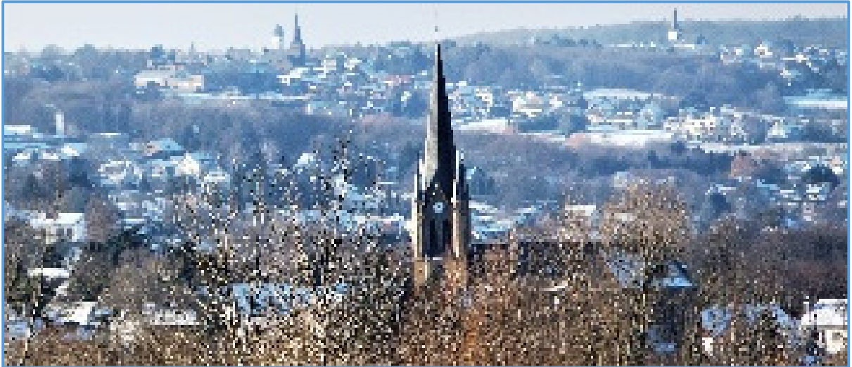
Blick vom LSV-Turm auf das Vorgebirge: im Vordergrund die Breniger Kirche, im Hintergrund der Rösberger Wasserturm