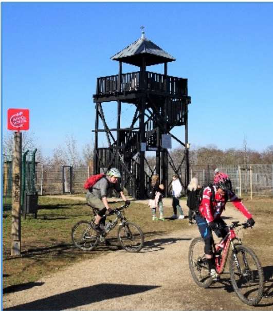
Der LSV-Aussichtsturm bietet viele Informationen zu Geschichte und Geologie

Der 4,6 km lange Spaziergang regt mit dem jüdischen Friedhof (1), dem Friedensweg samt Christusstatue (2/3) und am Aussichtsturm (5) – mit Informationen über das Engagement des LSV – zum Nachdenken über die Heimatgeschichte an.