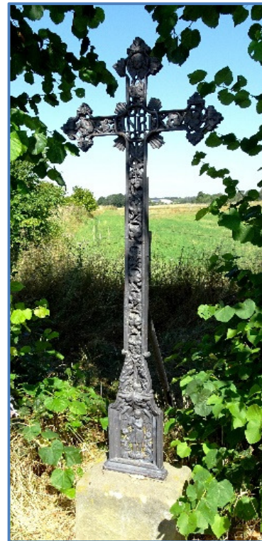
Rotes Kreuz am Kuckucksmaar (Station 7): einst rotes Holzkreuz, durch gusseisernes Grabkreuz von 1890 ersetzt.