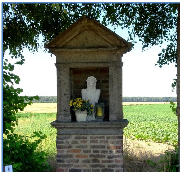
Heiligenhäuschen Ecce Homo (Station 3): errichtet um 1735, leidender Christus aus Muschelkalk.

Bildstöcke, Wegekreuze und Heiligenhäuschen sind bedeutende Zeugnisse des religiösen Brauchtums vergangener Tage. Diese Kleindenkmäler wurden von Privatpersonen aus Dankbarkeit für die Errettung aus Not oder als Bittkreuze gegen Unwetter oder Krankheit gestiftet bzw. selbst errichtet. In vielen Fällen werden sie bis heute gepflegt. Die Pilgerkreuze waren und sind nicht nur Wegweiser zu den Zielen von Pilgerwanderungen, sondern Stationen des Betens und Singens.