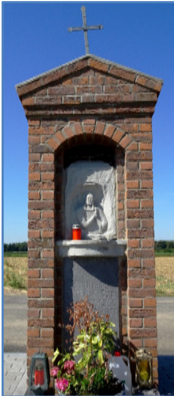
Donatus-Heiligenhäuschen (Station 6): 1787 zur Fürbitte gegen Blitz und Unwetter errichtet, nach Verkehrsunfällen wieder aufgebaut.

Ein Heiligenhäuschen-Wanderweg sollte gestaltet werden, um die Wegekreuze , Bildstöcke und Kapellen zu verbinden. Für solch einen Heiligenhäuschen-Weg eingesetzt hatte sich besonders Paul Krewer. Mit dem Preis wurden auch die Menschen geehrt, die sich jahrelang um die Heiligenhäuschen kümmern und noch kümmern. Sie pflegen die Denkmale, zünden Kerzen an und stellen Blumen auf. Der Wanderweg rückt diese ehrenamtlich tätigen Bürgerinnen und Bürger in den Mittelpunkt des Interesses.