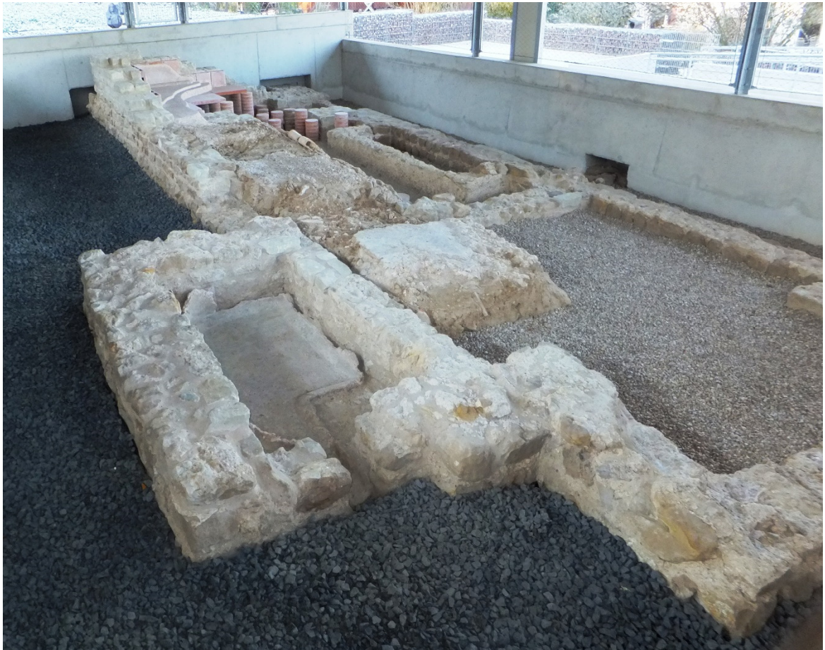
Badeanlage der VILLA FORTUNA