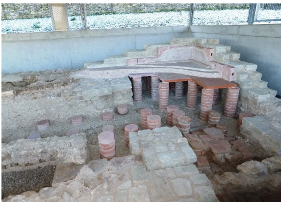
Hypokaustum (Boden- und Wandheizung) in der Badeanlage

Ca. 500 Jahre lang – zwischen 55 v.Chr. bis 450 n.Chr. gehörte das heutige Bornheimer Stadtgebiet zum römischen Reich. Germanenüberfälle konnten immer wieder zurück geschlagen werden. Erst Mitte des 5. Jahrhunderts wurde die römische Herrschaft durch fränkische Kleinkönige abgelöst.