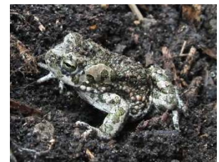
Auch die Kreuzkröte steht auf der Roten Liste gefährdeter Arten