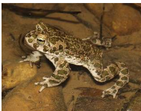
Die vom Aussterben bedrohte Wechselkröte

Der Herseler See wurde deshalb nicht zur Freizeitnutzung freigegeben, sondern ganz im Gegenteil als nicht zugängliches Naturschutzgebiet ausgewiesen. Nach dem Landschaftsplan Bornheim soll die Auskiesungsfläche zum „Lebensraum, insbesondere für Wasservogel und Amphibien“ erhalten und entwickelt werden.