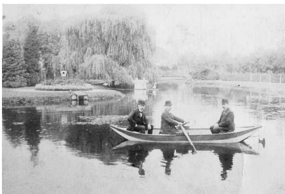
Historische Aufnahme des Roisdorfer Brunnenparks

Roisdorf-Bornheimer Bach, dem Möllerbaach . Dadurch hielt sich eine langgestreckte Gewässerzone , die erst im letzten Jahrhundert trocken gelegt wurde. Zwischen Roisdorf und Bornheim lag z.B. der 400 m lange Alte Weiher , der im Zuge des Baus einer neuen