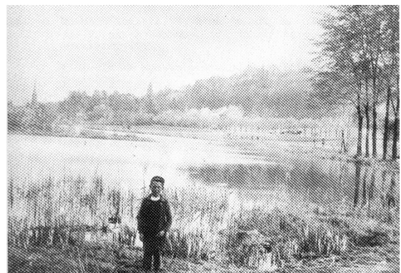
Der trocken gelegte „Alte Weiher“ bei Roisdorf um 1912