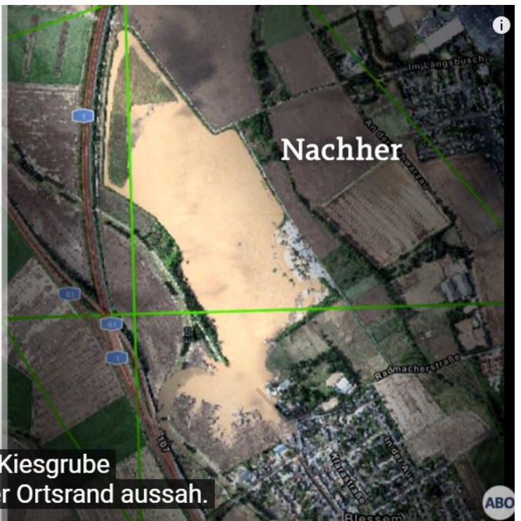
zwischen Kiesgrube und dem Blessemer Ortsrand aussah.